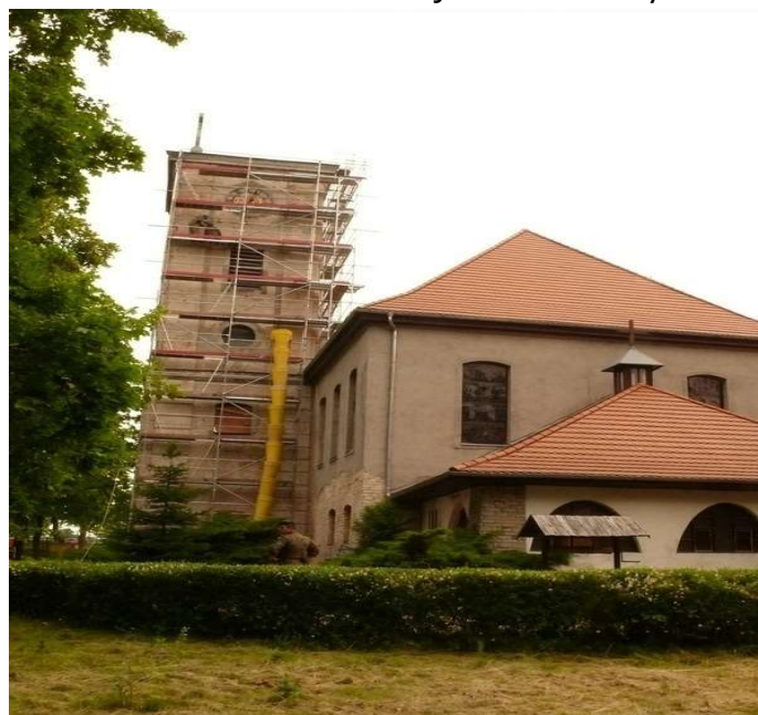
Fot. 6. Kościół w miejscowości Warzymice.