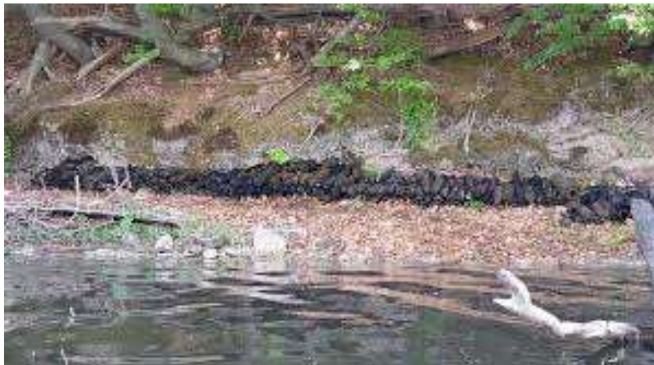
Fot. 5. Niewybuchy znalezione w Jeziorze Ciemne woj. Lubuskie.

związane z renowacją elewacji kościoła w Warzymicach w województwie zachodniopomorskim. w ścianie remontowanej wieży odkryto wbite pociski artyleryjskie z okresu II wojny światowej.