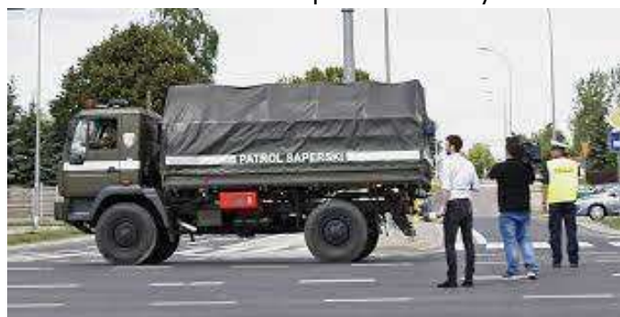
Fot. 10. Samochód do przewozu niewybuchów