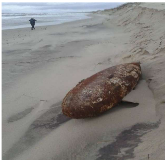
Fot.3. Niewybuch wyrzucony na plażę w czasie sztormu