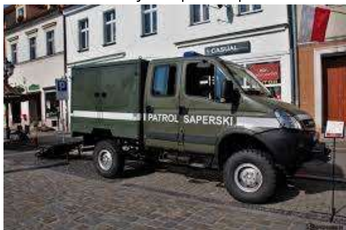
Fot. 9. Pojazd saperski Topola S