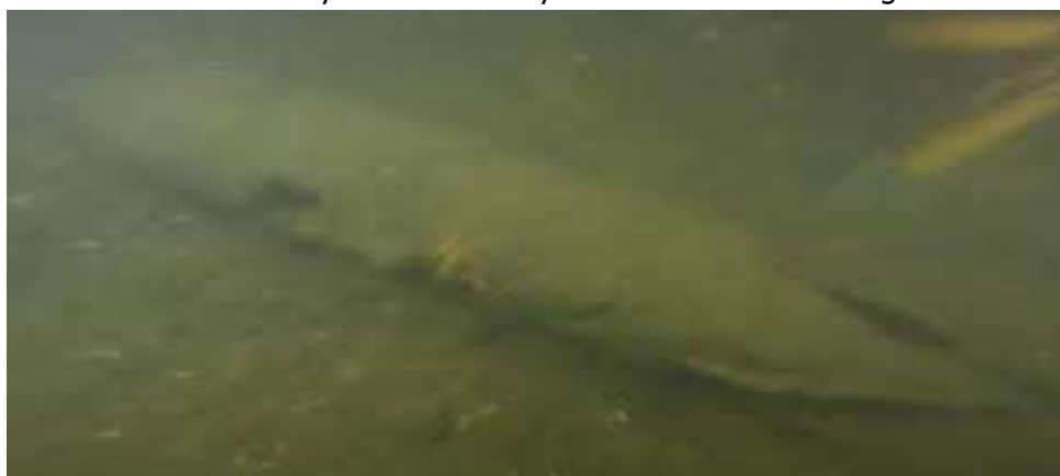
Fot.4. Niewybuch znaleziony na dnie Jeziora Karskiego