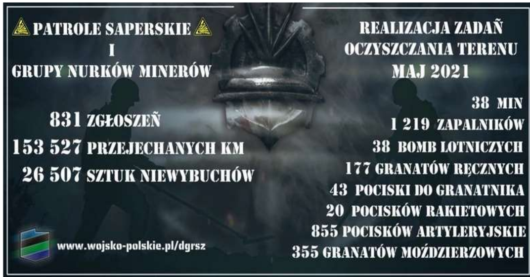
Fot. 8. Realizacja zgłoszeń przez patrole saperskie w I połowie 2021r.

saperskiego i próby podjęcia niewybuchu nastąpiła eksplozja znalezionych pocisków w wyniku której zginęło dwóch saperów zaś trzeci zmarł w szpitalu w wyniku odniesionych ran.